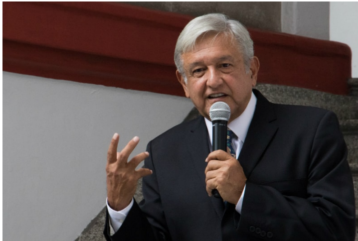
La política de desconcentración que está planteando el virtual presidente electo, Andrés Manuel López Obrador, con la que sacaría casi 20 secretarías de Estado de la capital, tendrá que sustentarse en estudios serios y amplios que muestren los pros y mitiguen los contras de cada caso